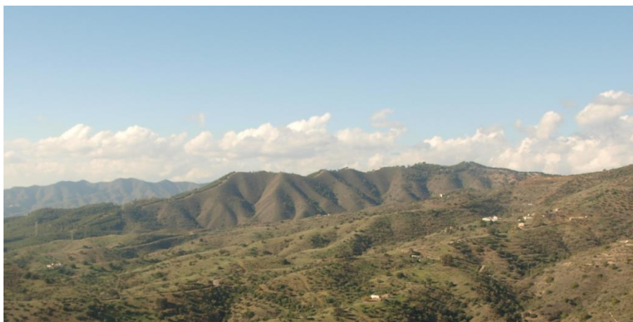
Imagen 13. Contraste entre las masas de pinos repobladas y los terrenos degradados por el hombre en los Montes de Málaga.

Esos terrenos fueron en su día un bosque de encinas, que fueron talados para la obtención de madera y carbón y se reconvirtieron posteriormente en suelo agrícolas, que hoy en día se encuentran abandonados.