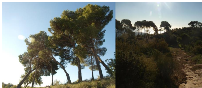
Imagen 5. Pinus halepensis supervivientes del incendio del 93.

a. Al tomar el camino hacia el “Mirador Este”, y en la misma intersección, nos encontramos con varios Pinus halepensis centenarios, únicos supervivientes del incendio de los montes en el 93. También vemos algarrobos, pinos de repoblación y olivos a ambos lados, así como calizas descubiertas en el suelo y algunos matorrales como el bayón o el lentisco.