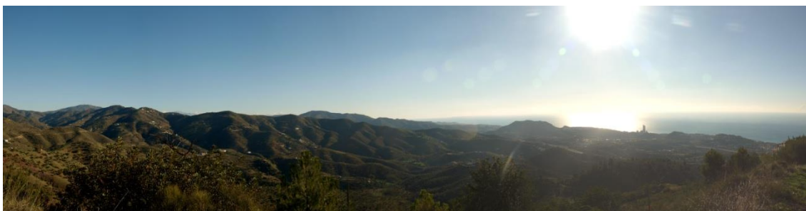
Imagen 3. Imagen panorámica de las vistas del este del paraje.

Nada más comenzar, podemos deleitarnos con unas preciosas vistas de los Montes de Málaga y del mar Mediterráneo.