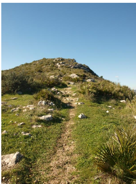
Imagen 9. Camino subida cima oeste.

Debido a que nos dirigimos hacia la cumbre de la cruz, situada al oeste, optaremos por el camino que queda a nuestra izquierda. Este camino, claramente marcado, discurre justo por la suave cresta que separa las vertientes de solana y umbría. La zona de umbría se caracteriza por presentar una gran pendiente salpicada de pinos, sin afloramientos rocosos visibles y tapizada por una vegetación más densa.