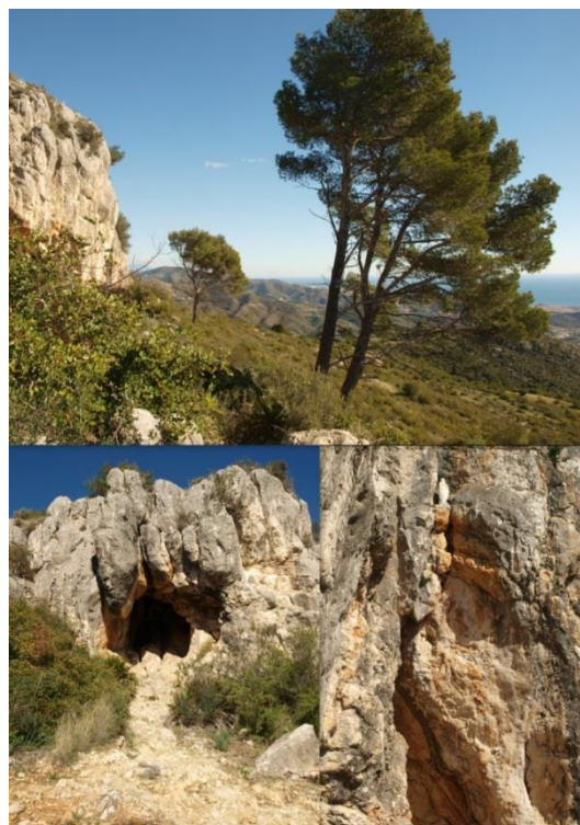
Imagen 14. Puntos de interés: Pinos centenarios, Cueva-refugio y Virgencita.

Sin lugar a dudas constituyen elementos que configuran una parada curiosa y característica del camino que vale la pena realizar.