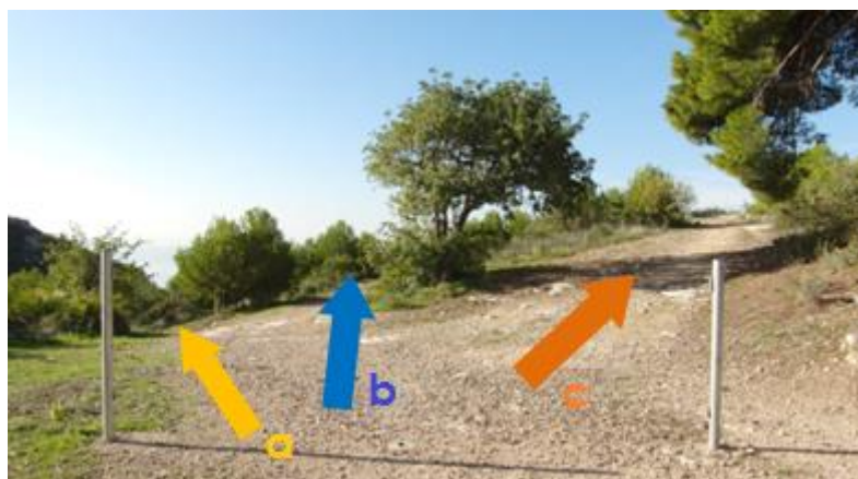
Imagen 4. Primera bifurcación, Punto 2 en el mapa.

a. Al tomar el camino hacia el “Mirador Este”, y en la misma intersección, nos encontramos con varios Pinus halepensis centenarios, únicos supervivientes del incendio de los montes en el 93. También vemos algarrobos, pinos de repoblación y olivos a ambos lados, así como calizas descubiertas en el suelo y algunos matorrales como el bayón o el lentisco.