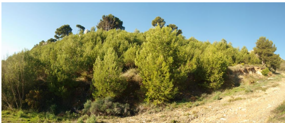
Imagen 2. Pinos de repoblación a la derecha del camino.

El camino comienza siendo pedregoso y con una pendiente no muy acusada. Podemos observar los pinos de repoblación a la izquierda del camino.