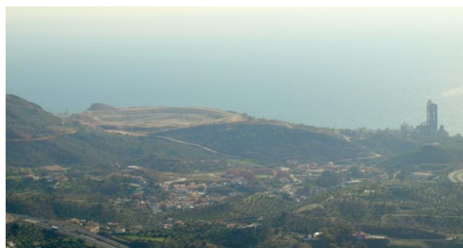
Imagen 7. Cantera de la cementera.

Una vista muy impactante que tenemos desde este mirador es la cantera de la que se abastece la cementera.