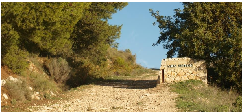
Imagen 1. Comienzo del camino

El inicio de la ruta está marcado por un monolito de entrada con las letras SAN ANTON (Punto 1 en el mapa).