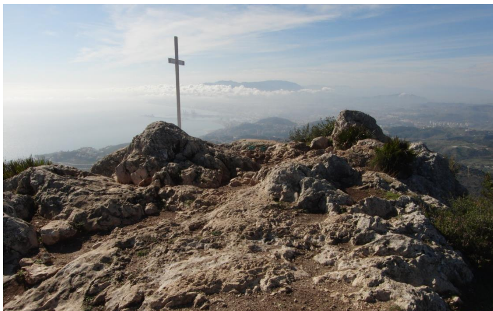
Imagen 10. Cima oeste. Cruz de San Antón.

Desde este punto aparece una visión más amplia de la ciudad malagueña, que puede ser observada casi en su totalidad.