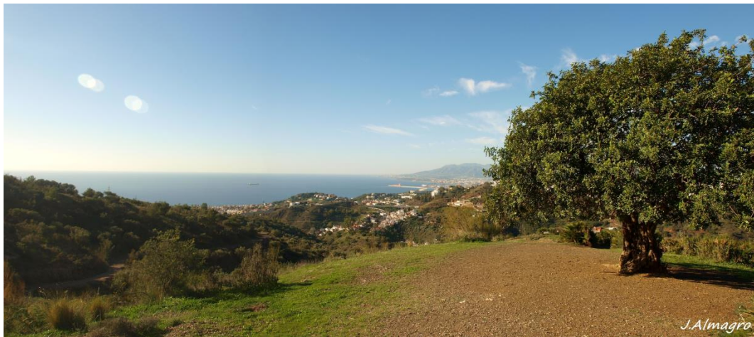
Imagen 5. Algarrobo.