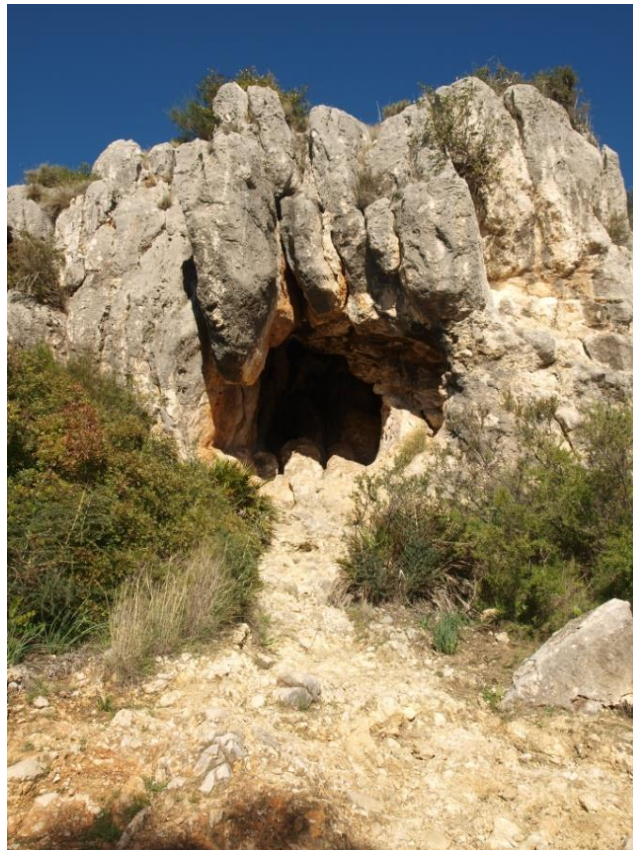
Imagen 3. Cueva situada a la izquierda de la Virgen.