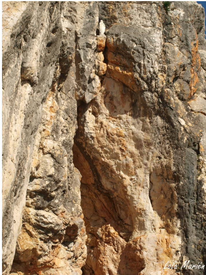
Imagen 2. Virgencita incrustada en el paredón a unos 10 metros de altura.