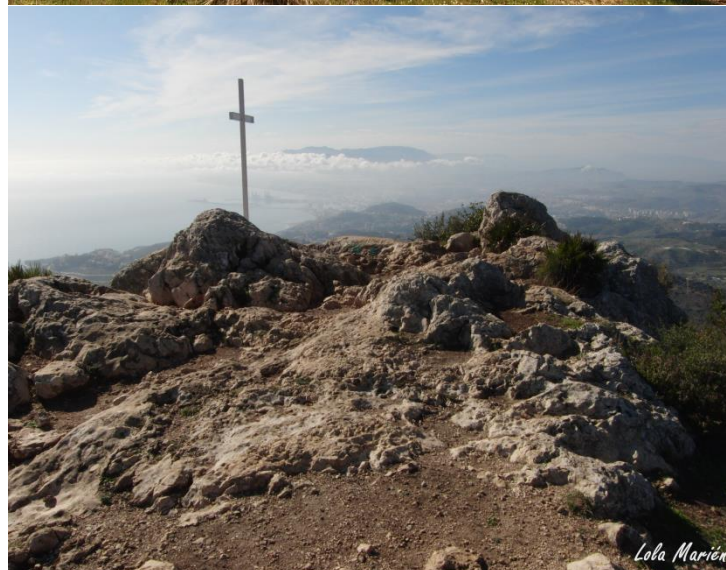
Imagen 6. Superior: Las dos cimas del Monte San Antón. Inferior: Detalle de la Cima Oeste donde se sitúa la Cruz de San Antón.