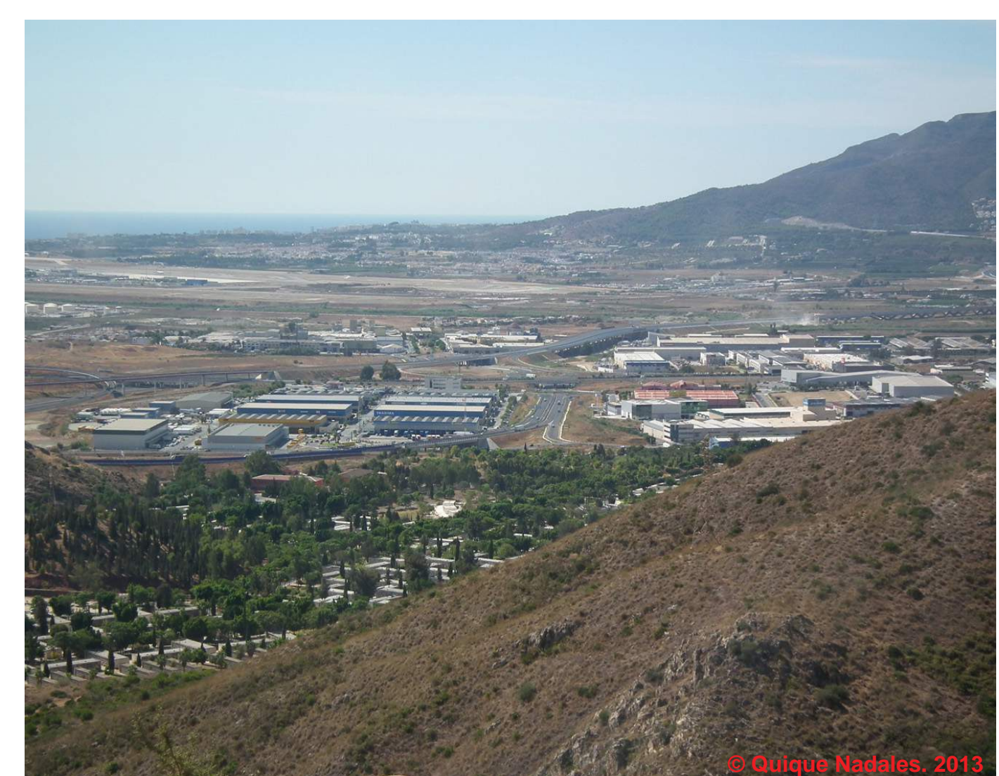
Vista general de los complejos industriales que ocupan el valle bajo del Guadalhorce. En primer término, el cementerio de San Gabriel.