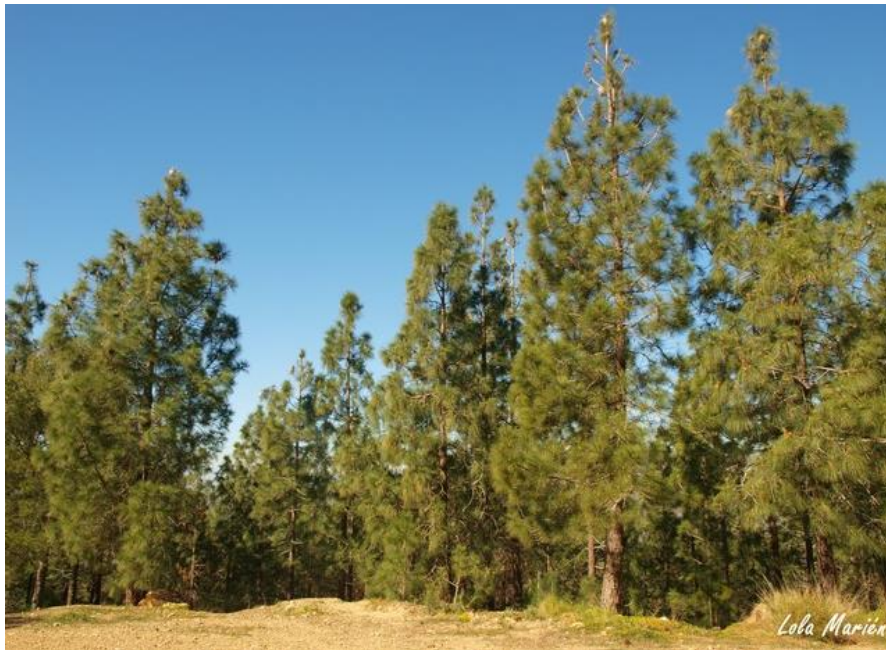
Imagen 3: Bosquete de Pino Canario.

A medida que nos aproximamos a este bosque, la presencia de pino carrasco dará paso al pino canario, lo que nos permitirá ver la diferencia entre una especie de pino y otra. El sendero se adentra hasta unos 500 m en este bosque.