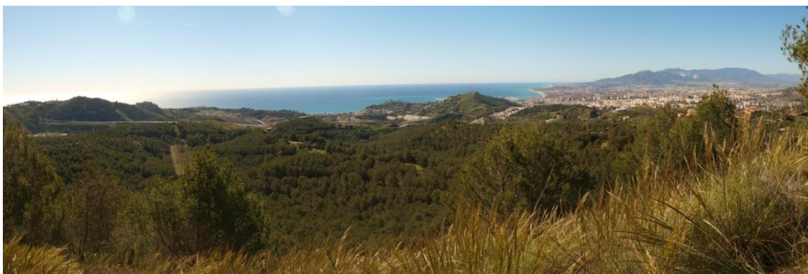
Imagen 4: Vistas desde el Mirador.

Una vez llegamos al final de este camino, volveremos por el mismo camino, llegando hasta la Intersección 2. Una vez en este punto, nos dirigiremos hacia el Mirador. Para ello tomaremos la desviación que no tomamos a la ida. La distancia entre el mirador y la intersección es de aproximadamente 600 m, es un recorrido que merece la pena hacer ya que nos permitirá observar una bonita panorámica de la bahía malagueña.