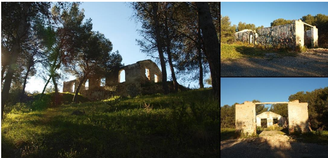
Imagen 6: Ermita de las Quirosas.

Mientras caminamos por este sendero veremos las ruinas de la Ermita de las Quirosas, que aunque se encuentra en un pobre estado de conservación, es uno de nuestros puntos de interés por su valor histórico.