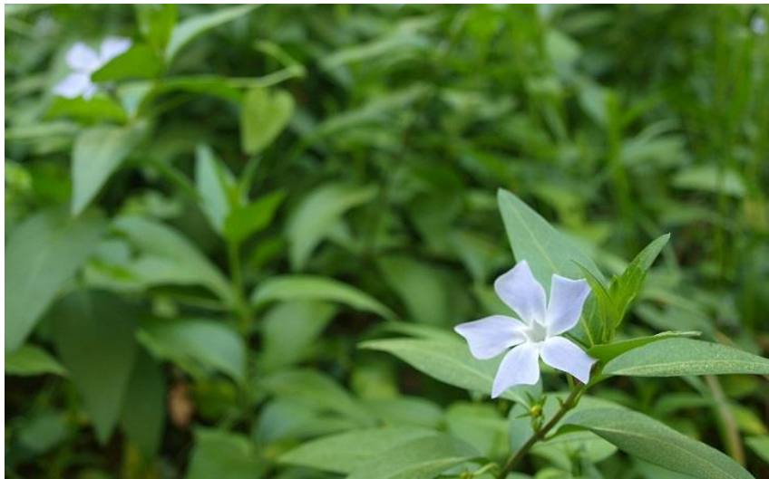
Imagen 8: Vinca difformis , planta típica de zonas húmedas y de umbría.

Este sendero terminará en una intersección, la Intersección 3, la misma con la que nos encontramos en la Opción A. En ésta, al igual que en el caso anterior tomaremos el pequeño sendero que encontramos en frente a la derecha, para ya volver al punto de inicio que se encuentra a unos 500 metros.