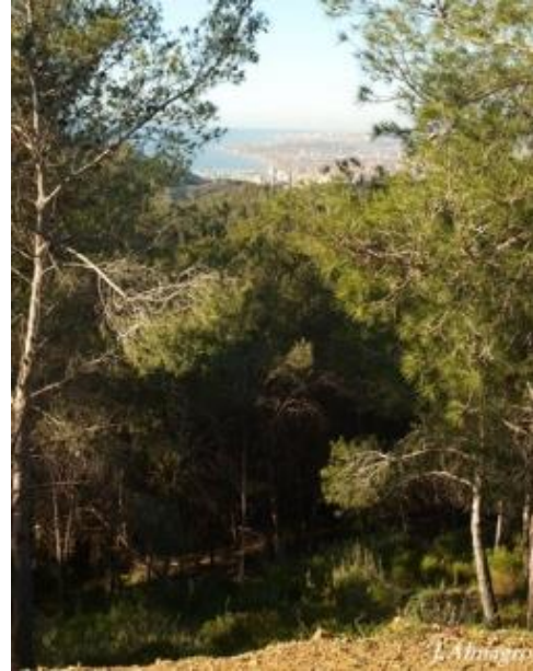
Imagen 5: Pinar con la ciudad de Málaga al fondo.

A escasos 100 metros de la intersección encontramos el inicio de un estrecho sendero a la izquierda. Caminaremos por este estrecho sendero durante aproximadamente 1,5 kilómetros. El sendero fluye entre un denso pinar. Además, está acondicionado para bicicletas, presenta rampas artificiales y las curvas están protegidas para los ciclistas, de ahí que esta parte del sendero forme parte de circuitos de trial y se realicen en él campeonatos de esta modalidad.