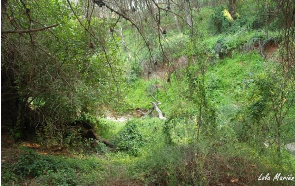
Imagen 7: Vegetación en el cauce del arroyo, notablemente más verde y espesa.

Este sendero terminará en una intersección, la Intersección 3, la misma con la que nos encontramos en la Opción A. En ésta, al igual que en el caso anterior tomaremos el pequeño sendero que encontramos en frente a la derecha, para ya volver al punto de inicio que se encuentra a unos 500 metros.