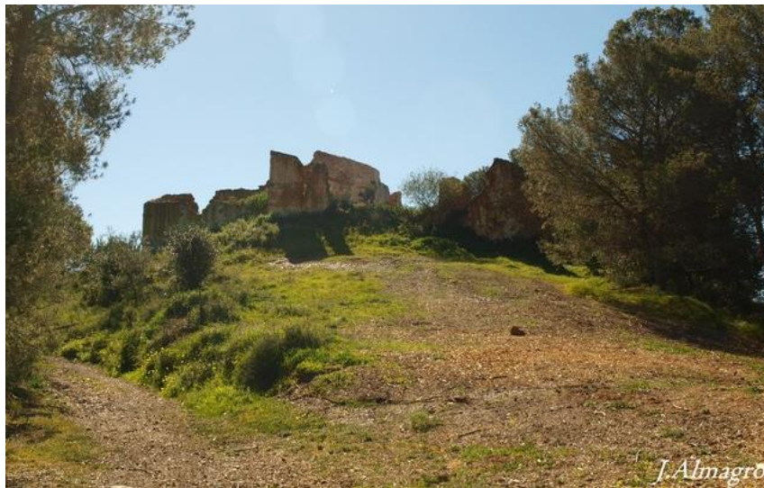
Imagen 8: Lagar de las Quirosas.

El Lagar de las Quirosas se encuentra en ruinas, pero nos aporta una bonita foto al encontrarse en lo alto de una loma y tener unas atractivas vistas.