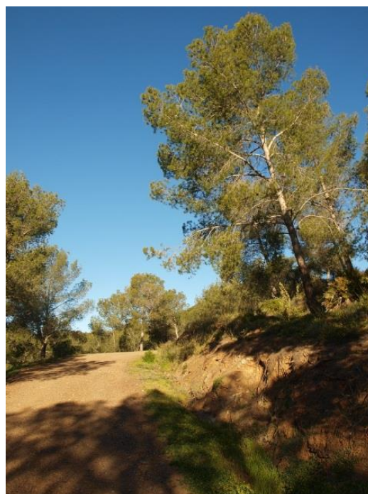
Imagen 2: Camino Inicial.

Así, el punto de inicio se encuentra en un amplio descampado a la salida de la carretera donde podremos dejar nuestro vehículo. Una vez que dejemos el vehículo comenzamos nuestro sendero por un amplio camino de fácil acceso. Este sendero circula a través de un denso pinar.